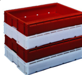
Ref. 9500_ DIM. (ext.) 725 x 485 x 130mm (int.) 680 x 475 x 118mm